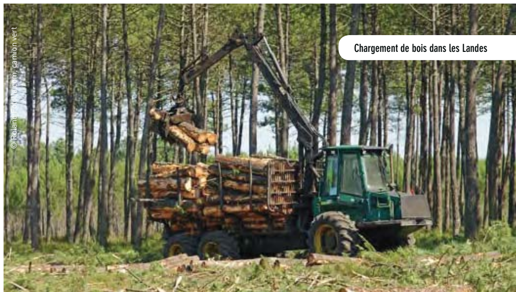
Chargement de bois dans les Landes

Si la France exporte des produits bruts pour importer des biens transformés, illustrant une logique de division internationale qui semble se répandre, le cas de la Chine – ou même plus paradoxalement de la Suède – est inverse. La Chine se caractérise par un désavantage comparatif en produits de la sylviculture, qu'elle importe, mais qu'elle compense en exportant des produits manufacturés issus