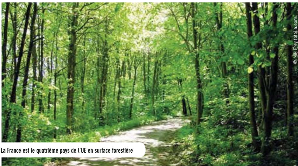
La France est le quatrième pays de l'UE en surface forestière

Il est souvent question des performances françaises en matière d'échanges commerciaux agroalimentaires. La filière bois ne connaît pas le même succès. Il s'agit d'un secteur qui dégage depuis de nombreuses années un déficit. Ce secteur a pourtant son intérêt, dans la mesure où la France est une puissance forestière de premier plan. Les Pouvoirs publics en ont ainsi fait, au moins depuis 2009, une priorité économique, en particulier pour la valorisation du bois et des territoires.