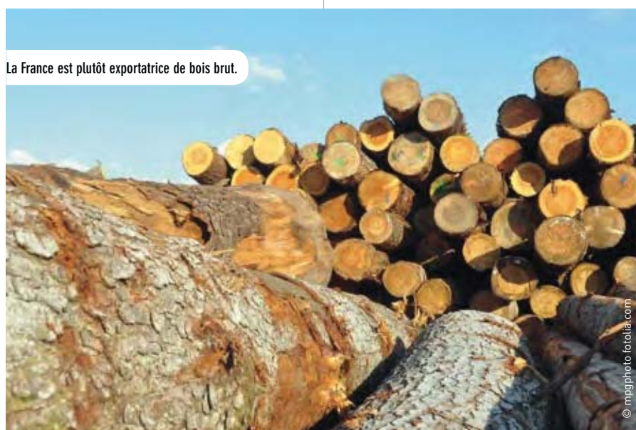
La France est plutôt exportatrice de bois brut.

En bois sciés et rabotés, cinq pays représentent près de 46 % des exportations mondiales, la France étant très mal classée dans cette hiérarchie. La Chine domine le marché mondial (près de 20 % des exportations), des articles en bois, liège et vannerie, devant l'Allemagne (9,7 %), le Canada et la France (respectivement 4,2 et 3,2 % des exportations mondiales). Les deux autres secteurs à valeur ajoutée pour lesquels la France est distancée sont les papiers et cartons, ainsi que les meubles. Dans le secteur des papiers et cartons, une domination écrasante est assurée par les Etats-Unis, l'Allemagne, la Suède, le Canada et la Chine, la France se classant au sixième rang, devant l'Italie et la Russie. En revanche, le premier exportateur mondial de meubles est l'Italie (près de 15 % des