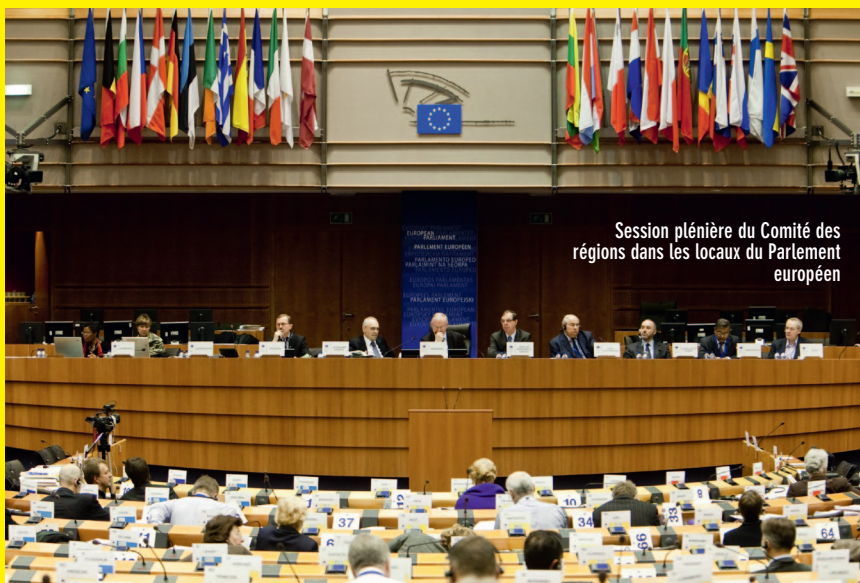
Session plénière du Comité des régions dans les locaux du Parlement européen

Centrées sur la question régionale, les priorités de travail du Comité ont évolué avec la nouvelle mandature, puisqu'elles concernent également la ville durable et la mobilité urbaine.