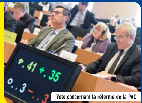
Vote concernant la réforme de la PAC

Les priorités du Parlement européen sont calquées sur celles du Conseil et de la Commission européenne. Les membres de la Commission de l'Agriculture et du Développement rural devront notamment se pencher sur la réforme des fruits et légumes ou sur la nouvelle réglementation de l'agriculture biologique. Les actualités internationale et européenne sollicitent également les députés que ce soit sur l'embargo russe ou sur les volets agricoles des négociations commerciales (Partenariat transatlantique de commerce et d'investissement, accord UE/Mercosur...). Concernant la Commission de l'Environnement, de la Santé publique et de la sécurité alimentaire, plusieurs sujets importants sont déjà inscrits à son agenda, parmi lesquels l'intégration des priorités environnementales dans