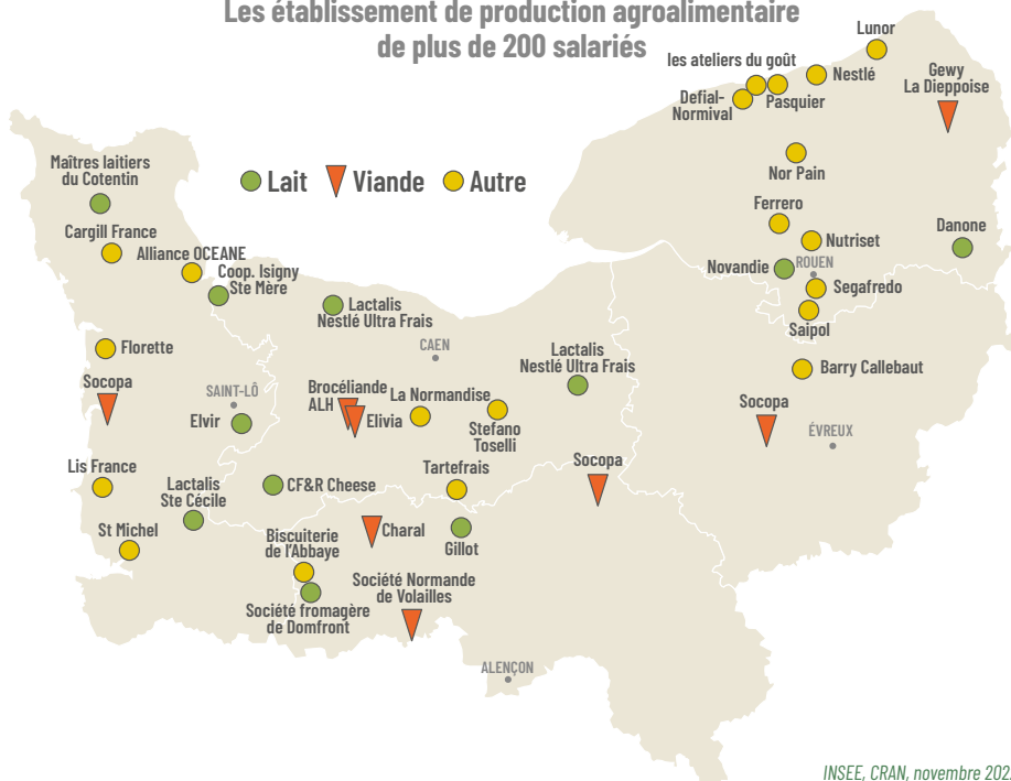
Les établissements de production agroalimentaire de plus de 200 salariés

Dans les départements de l'Eure et de la Seine-Maritime , du fait de l'activité portuaire. L'agroalimentaire est essentiellement orientée vers les produits d'épicerie et la transformation de matières premières importées (chocolat, thé, café...). La filière céréalière normande est également tournée vers l'export, le port de Rouen est le 1 er port ouest-européen exportateur de céréales.