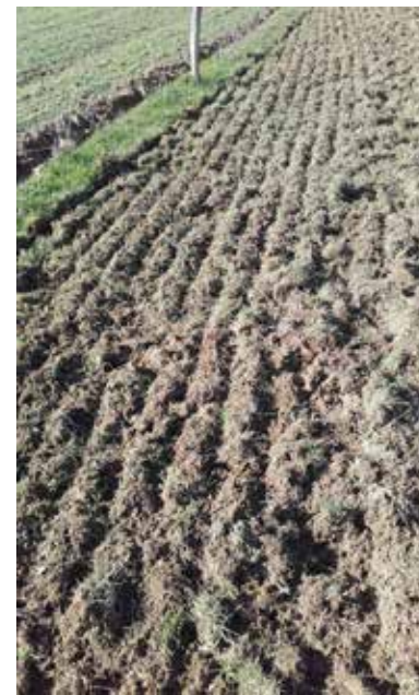
La prairie vient d'être détruite sans labour par un premier passage de rototiller.

Nous vous tiendrons au courant des prochaines visites de 2019 !