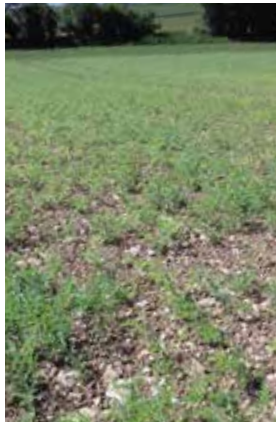
Parcelle de pois chiche en cours de végétation

La Chambre d'agriculture du Calvados, en partenariat avec la coopérative de Creully et Terres Inovia, a suivi un réseau de parcelles de pois chiche dans le département du Calvados. Trois parcelles ont été