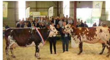
Photo de famille, à l'issue des remises de prix, avec Hérouville, la grande championne (à gauche) et Mandarine (à droite), prix espoir.