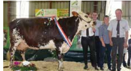
Propriété de l'EARL HOUSSIN (Pont Farcy - Tessy Bocage), Hérouville a remporté le premier prix de sa section pour les femelles en cours de 5ème lactation et plus, le prix de la Meilleure Mamelle adulte, le prix d'Honneur des vaches en lactation et le prix de Championnat.