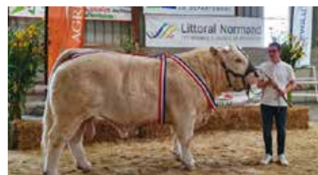
Mickey de l'EARL Delcourt, Grand Prix d'honneur Mâle