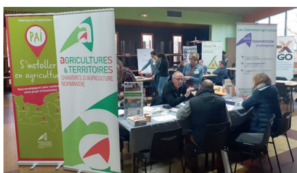
35 acteurs agricoles réunis pour répondre aux questions en direct