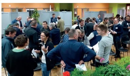
Temps d'interconnaissances entre les professionnels de la transmission/installation sur le territoire