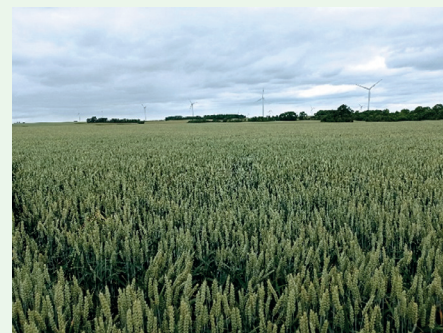
Voici une parcelle de blé en juin après 2 années de maïs : absence de Ray grass

Comparer ses marges c'est bien, sur la rotation c'est encore mieux. Certains membres du groupe Agriculture SOL vivant ont ainsi calculé leurs marges à la rotation sur trois campagnes successives de 2018 à 2020.