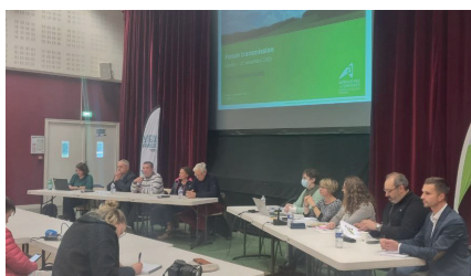
Les élus et les spécialistes de la transmission, prêts à répondre aux questions des agriculteurs.