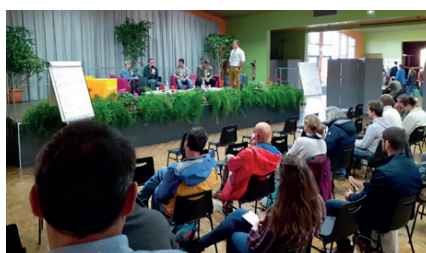
Trois tables rondes : accès au foncier, financements, transition vie agricole / vie de retraite