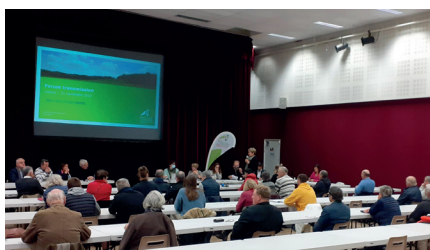
Des exposés économiques et juridiques sur les enjeux de la transmission