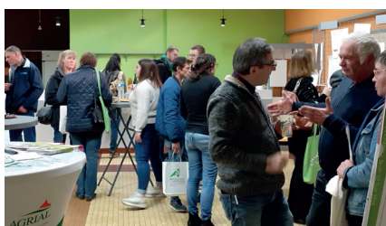
Espace convivial et échanges autour des petites annonces de cession et d'installation