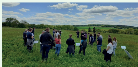
Essai prairies multi-espèces et luzerne : des références à valoriser