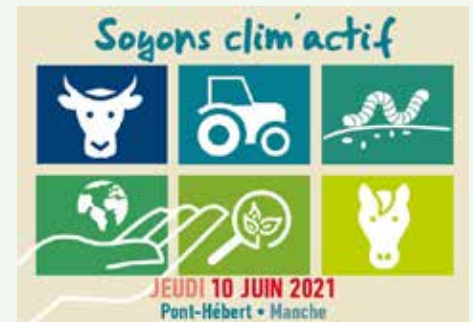
Plate-forme d'essais en grandes cultures bio

Contact : Catherine Bausson 02 31 47 22 69