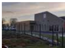
De la « tour de la Planche »... à la Douitée