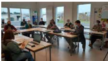
Réunion Elus-Salariés du 19 février, jusqu'à 17 personnes en salle de réunion, avec les gestes barrières

En projet depuis novembre 2016, sous l'ancienne mandature présidée par Michel LEGRAND, la construction commençait en juillet 2019, suivie par le Service Logistique,