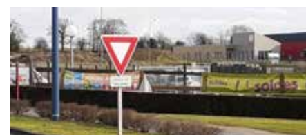
Accessible par la route Caen-Vire et visible de la Rocade de Vire