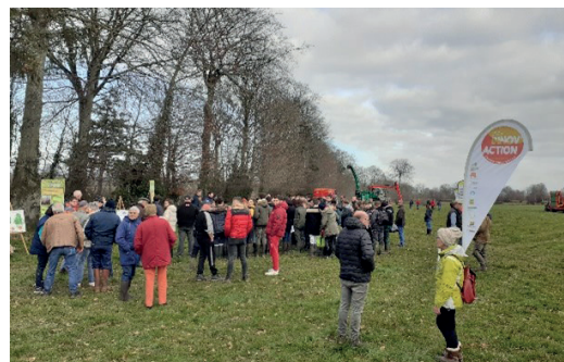
... et plan de gestion durable des 9,3 km de haies