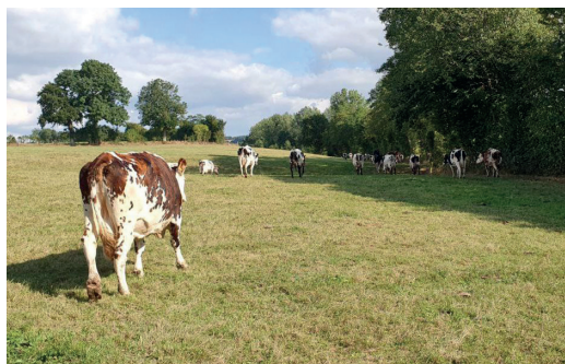
Parmi les leviers d'action sur l'exploitation : pâturage maximum en complément du maïs.