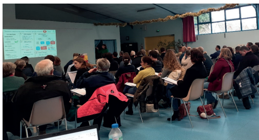
Réunion PAC 2023 à Coquainvilliers

2023 a vu la mise en place d'une nouvelle programmation PAC et de nouvelles règles pour accéder à l'éco-régime via l'une des trois voies : pratiques agricoles et diversité d'assolement, certifications (AB ou HVE) ou par le biais des éléments de biodiversité. La forte pluviométrie de l'automne a perturbé la mise en place des cultures d'automne et certains exploitants pourraient avoir plus de difficulté à réunir les 5 points nécessaires pour bénéficier du montant maximum de l'éco-régime.