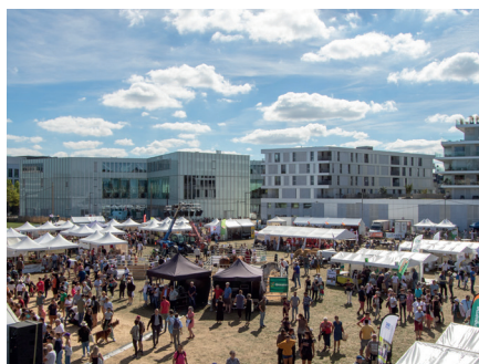
Un succès avec 8 420 visiteurs sur la journée