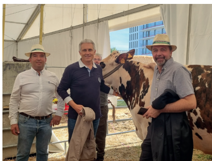
Une manifestation qui n'aurait pu avoir lieu sans l'aide de la Mairie de Caen