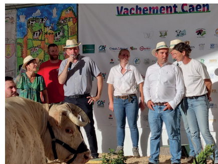
Des membres fondateurs satisfaits de cette première édition