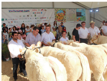
Les jeunes artistes réalisateurs de l'affiche de l'événement admirent de belles charolaises