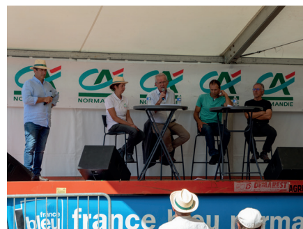
La conférence VACHEMENT Biodiversité a rassemblé bon nombre de participants intéressés par le sujet