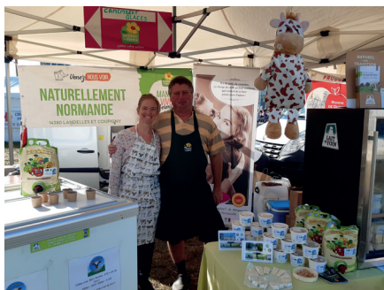
Une trentaine de producteurs a proposé des produits emblématiques de la Normandie