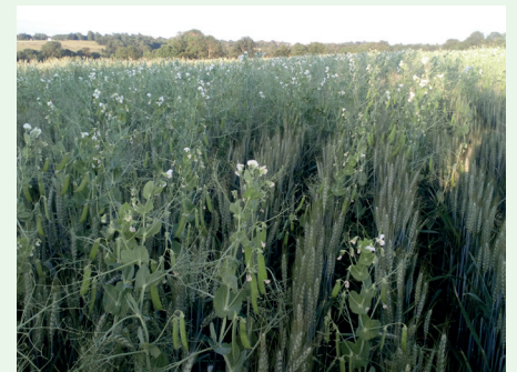
Association de blé et pois fourragers à fleurs blanches

Les mélanges triticales- féverole, orge-poïs protéagineux, ou blé-poïs fourragers à fleurs blanches sont très cultivés pour leur complémentarité et leur pouvoir couvrant sur les adventices. Plusieurs dosages permettront de vérifier l'adéquation entre doses de semis et rendements finaux de chaque culture.