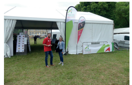
Le stand de la Chambre d'agriculture