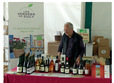
Les Vergers de Ducy