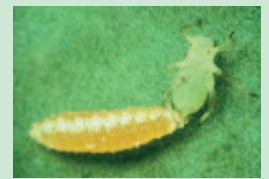
Larve Aphidoletes Prédateur de pucerons