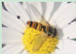
Syrphe adulte sur anthesis Prédateur de pucerons