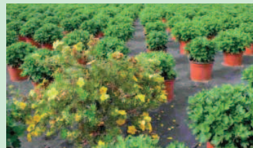
Potentille dans une parcelle de chrysanthèmes en extérieur