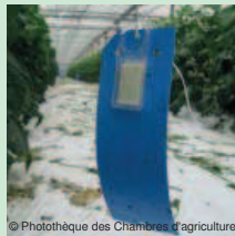
Pièges englués jaune et bleu