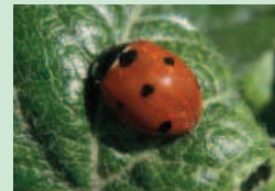
Coccinella septempunctata Prédateur de pucerons