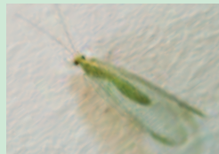
Chrysope adulte Prédateur de pucerons, cochenilles, thrips, acariens...