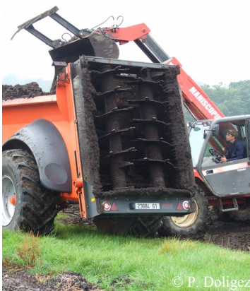
Epandeur à hérisson