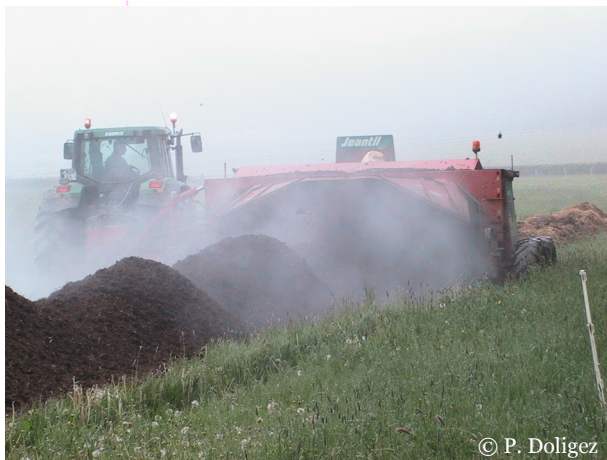
Composteuse ou retourneur d'andain

Nota : Pour porter la mention « biologique » un produit agricole doit respecter les règles spécifiques à la production biologique définies dans l'un des règlements reconnus par la communauté européenne et l'opérateur doit obtenir un certificat valide pour ce produit. Pour cela, chaque opérateur doit s'engager à être contrôlé par un organisme tiers indépendant accrédité selon la norme guide ISO 65, tel qu'ECOCERT.