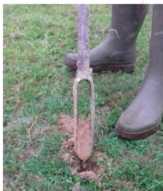
Carottage avec une tarière pour prélever de la terre en vue d'une analyse de sol