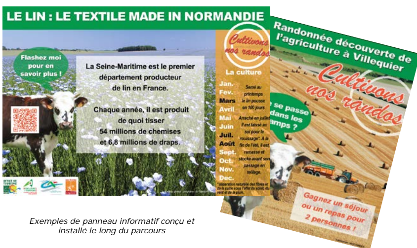
Exemples de panneau informatif conçu et installé le long du parcours

L'information a également été bien relayée par la presse locale.